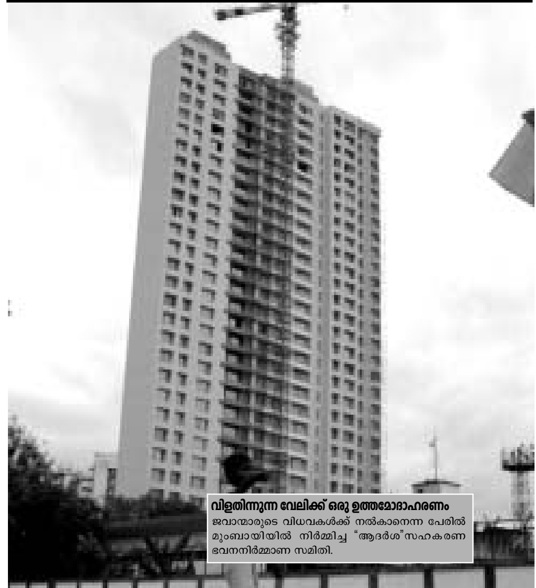
വിളിയിലൂടെ വേലിക്ക് ഒരു ഉത്തമോദാഹരണം ജവാന്മാരുടെ വിധവകൾക്ക് നൽകാനെന്ന പേരിൽ മുംബായിയിൽ നിർമ്മിച്ച “ആദർശ” സഹകരണ ഭവനനിർമ്മാണ സമിതി.