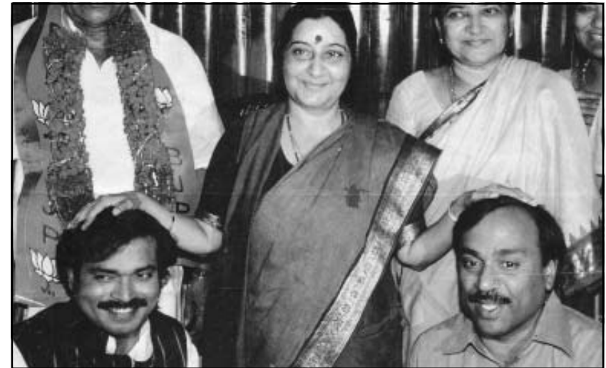
സുഷമ സ്വരാജും ബല്ലാരി സഹോദരന്മാരും (റെഡ്ഡിമാർ)

ഏതായാലും ഇരുപതാം നൂറ്റാണ്ടിന്റെ ഉത്തരാർദ്ധം വരെ ഇന്ത്യയിലെല്ലായിടത്തും ത്യാഗികൾ ഏറെ വിഹരിച്ചിരുന്നു. പിന്നീട് എവിടെവെച്ചോ നാം കാൽ വഴുതി വീണുപോയി. അധികാരത്തിനുള്ള ആർത്തി സമ്പത്തുണ്ടാക്കാനുള്ള ആർത്തിയായി. അധികാരം നിലനിർത്താനും പിടിച്ചെടുക്കാനുമുള്ള ആർത്തി നമ്മെ സകല ദുഷ്കർമ്മങ്ങളിലേക്കും ആനയിച്ചു. മോഷ്ടിക്കുന്നതും നൂണ പറയുന്നതും ഇന്ന് മാന്യ