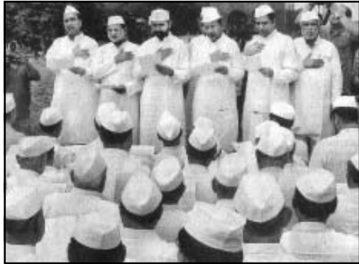
ഹസാരയുടെ സമരത്തെത്തുടർന്ന് ഗാന്ധി തൊപ്പിക്ക് വീണ്ടും പ്രസക്തി

തൊപ്പിയുടെ രൂപനിർണയം നടത്തി കഴിഞ്ഞതോടെ, അതിന്റെ നിറത്തെപ്പറ്റിയായി ഗാന്ധിജിയുടെ ചിന്ത.