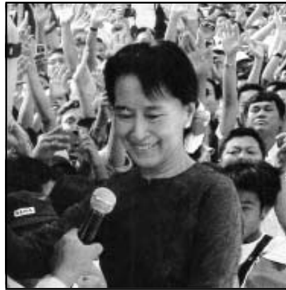
ഓങ് സാൻ സുകി

മ്യാൻമാറിലെ ജനാധിപത്യ പ്രസ്ഥാനത്തിന്റെ നേതാവായ ഓങ് സാൻ സുകി പത്തുകൊല്ലത്തോളം നീണ്ടു നിന്ന വീട്ടുതടങ്ങലിനു ശേഷം നവമ്പർ 13ന് മോചിതയായി. ദീർഘകാലം തടങ്ങലിലായിരുന്നിട്ടും സുകിയുടെ ജന പിന്തുണക്ക് ലേഗും പോലും ക്ഷീണം തട്ടിയിട്ടില്ലെന്ന് അവരെ സ്വീകരിക്കാനെത്തിയ നാല്പതിനായിരത്തിൽ പരം ജനങ്ങൾ സാക്ഷ്യപ്പെടുത്തുന്നു. ഇതിനു മുമ്പ് 2002 മേയിലാണ് സുകിക്ക് തടങ്കലിൽ നിന്ന് ഹ്രസ്വകാലത്തേക്ക് മോചനം ലഭിച്ചത്. അന്നവരെ സ്വീകരിക്കാനെത്തിയവരേക്കാൾ വമ്പിച്ച ജനത തിയാണ് ഇത്തവണ “ജനാധിപത്യത്തിനുള്ള നാഷണൽ ലീഗ്” എന്ന സംഘടനയുടെ ആസ്ഥാന മന്ദിരത്തിൽ തടിച്ചുകൂടിയത്.