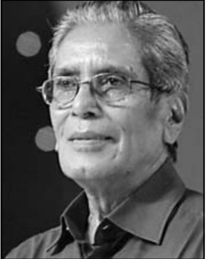
ജെ. സി. ഡാനിയൽ

ലംഘിച്ച് സമകാലിക സാമൂഹികാവസ്ഥയുമായി ബന്ധപ്പെട്ട കഥയാണ് ഡാനിയൽ സിനിമയാക്കിയത്. അദ്ദേഹത്തിന്റെ ഈയൊരു ധീരത ആരും കൊണ്ടാടിയില്ല. മൗനത്തിലും അവഗണനയിലും ആ ജീവിതം അവസാനിച്ചു.