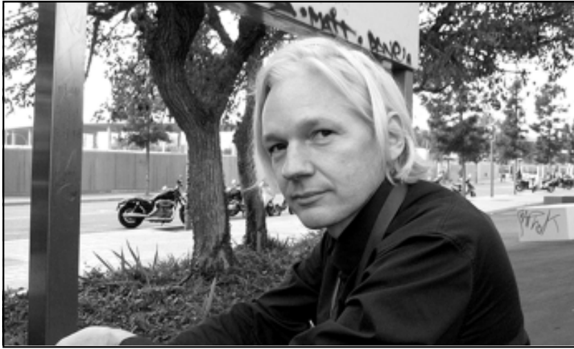
വിക്ലിപീഡിയൻ സ്ഥാപകൻ ജൂലിയൻ അസംഗെ

വെബ്സൈറ്റുകളിൽ കയറിപ്പറ്റാൻ ഇവരുടെ കമ്പ്യൂട്ടറുകളാണ് ഉപയോഗിക്കുന്നത്. എന്നാൽ ബഹുഭൂരിപക്ഷത്തിനും - ഏതാണ്ട് 99 ശതമാനത്തിനും സംഘടനയുടെ പ്രവർത്തനങ്ങളിൽ സ്വാധീനമൊന്നുമില്ല.