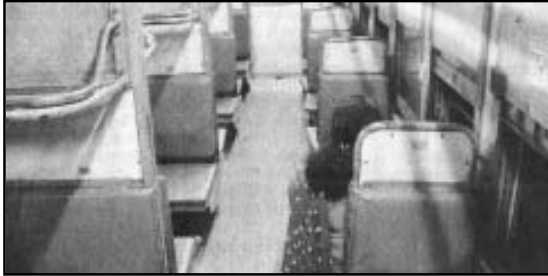
എറണാകുളം-ഷൊർണൂർ പാസഞ്ചർ വണ്ടിയുടെ വനിതാ കമ്പാർട്ട്മെന്റിൽ ഒറ്റക്ക് യാത്ര ചെയ്യുന്ന ഒരു സ്ത്രീ

ബഡ്ജറ്റ് പ്രസംഗത്തിൽ റെയിൽവേ മന്ത്രി ഉറപ്പു നൽകിയ പല യാത്രാവണ്ടികളും ഇനിയും ഓടിത്തുടങ്ങിയിട്ടില്ലെന്ന് ഒരാക്ഷേപം ഈയിടെ പത്രങ്ങളിൽ വായിക്കുകയുണ്ടായി. തങ്ങൾ വഞ്ചിക്കപ്പെട്ടുവെന്ന് ജനങ്ങൾക്ക് തോന്നുന്നുണ്ടെങ്കിൽ അതിന്നവരെ കുറ്റം പറഞ്ഞിട്ട് കാര്യമില്ല. പക്ഷെ അതിന്നു പുറമുള്ള ചില വസ്തുതകൾ ജനങ്ങൾ അറിഞ്ഞിരിക്കേണ്ടതുണ്ട്.