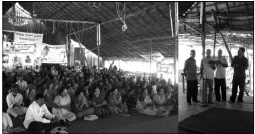
കൂടംകുളത്ത് നടന്നുവരുന്ന ആണവ വിരുദ്ധ സമരത്തിന്റെ ഒരു ദൃശ്യം

ഈ സമരം പരാജയപ്പെടില്ല. ഉറപ്പാണ്. പ്രധാന കാരണം സമരത്തിന്റെ നിയന്ത്രണം രാഷ്ട്രീയക്കാരുടേയോ, മതമൗലിക വാദികളുടേയോ, ബുദ്ധിജീവികളുടേയോ, എൻ.ജി.ഒ. കളുടേയോ കയ്യിലല്ല എന്നതാണ്. ആണവ വിപത്തിനെക്കുറിച്ച് വാചാലമായി സംസാരിക്കാൻ കഴിയുന്ന സാധാരണക്കാരായ മനുഷ്യരുടെ മേൽനോട്ടത്തിലും നിയന്ത്രണത്തിലുമാണ് സമരം നടക്കുന്നത്. അതിൽ വനിതകളുടെ പങ്കാളിത്തം സവിശേഷ ശ്രദ്ധയർഹിക്കുന്നു. ആണവ പദ്ധതിയെ വാഴ്ത്തിക്കൊണ്ടും പ്രതിരോധ സമരക്കാർക്കെതിരെ അടിസ്ഥാന രഹിതമായ ആരോപണങ്ങൾ നിരത്തിയും രംഗത്തുവന്ന പ്രധാനമന്ത്രി മൻമോഹൻസിങ്, മുൻ പ്രസിഡന്റ് അബ്ദുൾകലാം, പുതുച്ചേരി എം.പി.യും മന്ത്രിയുമായ വി. നാരായണ സ്വാമി എന്നിവർക്ക് വനിതകൾ നൽകുന്ന മറുപടി കേട്ട് അക്ഷരാർത്ഥത്തിൽ ഞങ്ങൾ അമ്പരന്നു. സമരക്കാരുടെ സാമ്പത്തിക പ്രസാദസ്മരണങ്ങളുടെ ഓഫീസിന്റെ ചുമതലയുള്ള മന്ത്രി നാരായണസ്വാമി ആവശ്യപ്പെട്ടത്. സമരക്കാർ ആ വെല്ലുവിളി ഏറ്റെടുക്കുന്നു. അതോടൊപ്പം അവർ ഒന്നുകൂടി ആവശ്യപ്പെടുന്നു. കൂടംകുളം പദ്ധതിയുടെ മുഴുവൻ കണക്കുകളും സർക്കാർ വെളിപ്പെടുത്തണം. പദ്ധതി