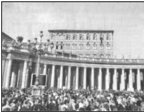
സെന്റ് പീറ്റേഴ്സ് ബസിലിക്ക - മാർപ്പാപ്പമാരുടെ പള്ളി - ലോകത്തിലെ ഏറ്റവും വലിയ പള്ളികളിലൊന്ന്. വിശുദ്ധ പത്രോസിന്റെ ശ്മശാനത്തിനു മേൽ നിർമ്മിക്കപ്പെട്ടതാണ് വിശ്വസിക്കപ്പെടുന്നത്.

കത്തോലിക്ക സഭയുടെ ഒരു മുഖ്യ ഘടകമാണ് ഐറിഷ് കത്തോലിക്ക സഭ. ഗർഭമലസി കുന്നതിനെ ഇന്നും നിരോധിച്ചു വരുന്ന രാജ്യമാണത്. വിവാഹ മോചനത്തിന് മറ്റു രാജ്യങ്ങളെല്ലാം അനുമതി നൽകിയപ്പോൾ അയർലാൻഡ് അതിനെ എതിർത്തുപോന്നു. 1995 ൽ മാത്രമേ അയർലാൻഡിൽ വിവാഹ മോചനം അനുവദനീയമായുള്ളൂ. അങ്ങനെയുള്ള ഒരു യഥാസ്ഥിതിക കത്തോലിക്ക രാജ്യമാണ് ഇപ്പോൾ വത്തിക്കാനെതിരെ പടപുറപ്പാട് നടത്തിയിരിക്കുന്നത്.