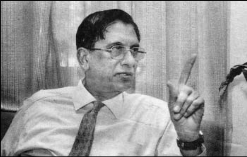
സ്പെഷൽ അന്വേഷണ സംഘത്തിന്റെ തലവനായ ആർ.കെ. രാഘവൻ

4. വിശ്വഹിന്ദു പരിഷത്ത് ഒരു ബന്ദിന് ആഹ്വാനം ചെയ്ത സ്ഥിതിക്ക് കരുതൽ നടപടികളൊന്നും സ്വീകരിക്കാതിരുന്നതെന്തുകൊണ്ടാണ്?