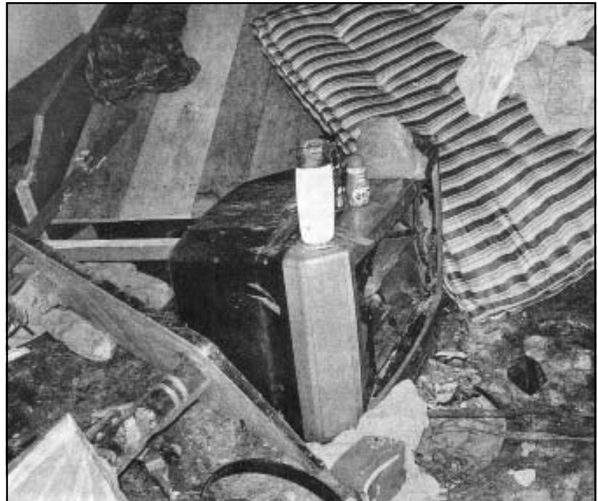
മാർച്ച് 30ന് ബലിഗോത്ത ഗ്രാമത്തിൽ പോലീസ് നടത്തിയ പരാക്രമങ്ങളിൽ തകർന്ന ഒരു വീട്