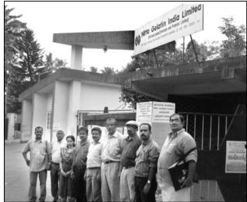
ജനനീതി പഠനസംഘം നിറ്റാ ജലാറ്റിൻ കമ്പനിക്കു മുമ്പിൽ

(തൃശൂർ ജില്ലയിലെ ചാലക്കുടിക്ക്ടുത്ത് കാതിക്കൂടം എന്ന പ്രദേശത്തെ ജനജീവിതത്തെയാകെ തകരാറിലാക്കുന്ന “നിറ്റാ ജലാറ്റിൻ ഇന്ത്യ ലിമിറ്റഡ്” എന്ന കമ്പനിയുടെ പ്രവർത്തനത്തെപ്പറ്റി ജനനീതി നിയോഗിച്ച വിദഗ്ധ സംഘത്തിന്റെ റിപ്പോർട്ടിൽനിന്നുള്ള പ്രസക്തഭാഗങ്ങൾ)