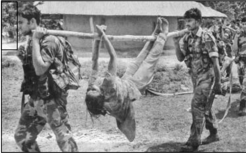
മനുഷ്യത്വം മരവിക്കുമ്പോൾ സംഭവിക്കാവുന്നത്: ബംഗാളിൽ രക്ഷാഭടന്മാരുമായുള്ള ഒരേറ്റുമുട്ടലിൽ കൊല്ലപ്പെട്ട ഒരു യുവതിയെ ചത്ത നാല്ക്കാലിയെ എന്നപോലെ എടുത്തുകൊണ്ടുപോകുന്നു.

രക്ഷാസേനയുമായുണ്ടായ ഏറ്റുമുട്ടലിൽ മരിച്ചവർ എത്രയായാലും ശരി, പോലീസിന് എട്ടു മുതലേറങ്ങളേ കിട്ടിയിട്ടുള്ളൂ. എവിടെനിന്നോ പിടികൂടിയ ഒരു ചെറുപ്പക്കാരനെ മാവോയിസ്റ്റ് എന്ന മുദ്രകുത്തി അറസ്റ്റ് ചെയ്തിട്ടുണ്ട്. (ഒരാൾ മാവോയിസ്റ്റാണോ കമ്മ്യൂണിസ്റ്റാണോ സോഷ്യലിസ്റ്റാണോ എന്നൊക്കെ തിരിച്ചറിയുന്നതെങ്ങനെയാണ്?) പിടികിട്ടിയ മുതലേറങ്ങളെ രക്ഷാസേനക്കാർ കാട്ടിൽനിന്ന് നീക്കം ചെയ്തിട്ടുണ്ട്. ഭാരമുള്ള ഒരു സാധനം നീക്കം ചെയ്യുന്നതെങ്ങനെയാണ്? മരത്തടിയോ മറ്റോ ആണെങ്കിൽ കയർ കെട്ടിവലിച്ചു നീക്കാം. പശു, പോത്ത് തുടങ്ങിയ ഇടത്തരം മൃഗങ്ങളാണ് ചത്തതെങ്കിൽ, ഒരു മുളംതണ്ടിൽ കെട്ടിയെടുത്ത് നീക്കം ചെയ്യുകയാണ് പതിവ്. മരിച്ചത് മനുഷ്യനാണെങ്കിൽ, മുതലേറം നീക്കം ചെയ്യാൻ മാർഗ്ഗം പലതുണ്ട്. രണ്ടോ മൂന്നോ പേർ ചേർന്ന് എടുത്തുമാറ്റാം; അല്ലെങ്കിൽ ഒരു സ്ത്രീയ്ക്ക് ഉപയോഗം