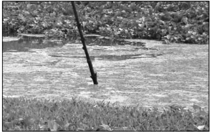
ചാലക്കുടി പുഴയിൽ നിന്നു ജലാറ്റിൻ കമ്പനി ഒഴുക്കുന്ന മാലിന്യം

മലിന ജലത്തിന് വല്ലാത്ത ദുർഗന്ധമുണ്ട്. കമ്പനിയിലെ ജീവനക്കാർക്ക് എന്തെങ്കിലും രക്ഷാ നടപടി ഏർപ്പെടുത്തിയതായി കണ്ടില്ല.