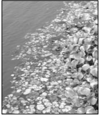
കമ്പനി പുറന്തള്ളുന്ന മാലിന്യം ചാലക്കുടി പുഴയിൽ

ഫാക്ടറി ആരംഭിച്ച കാലത്ത് പരിസ്ഥിതിയെപ്പറ്റിയൊന്നും ആർക്കും ഒരരത്നം പിടിയുമുണ്ടായിരുന്നില്ല. സൈലന്റ് വാലി പ്രക്ഷോഭണമാരംഭിക്കുന്നതിനെല്ലാം മുമ്പ് സ്ഥാപിതമായതാണ് ഈ ഫാക്ടറി. പരിസ്ഥിതി സംരക്ഷണത്തെക്കുറിച്ചുള്ള പ്രധാനമന്ത്രി ഇന്ദിരാഗാന്ധിയുടെ പ്രസിദ്ധമായ സ്റ്റോക്ക് ഹോം പ്രഖ്യാപനമുണ്ടായതു