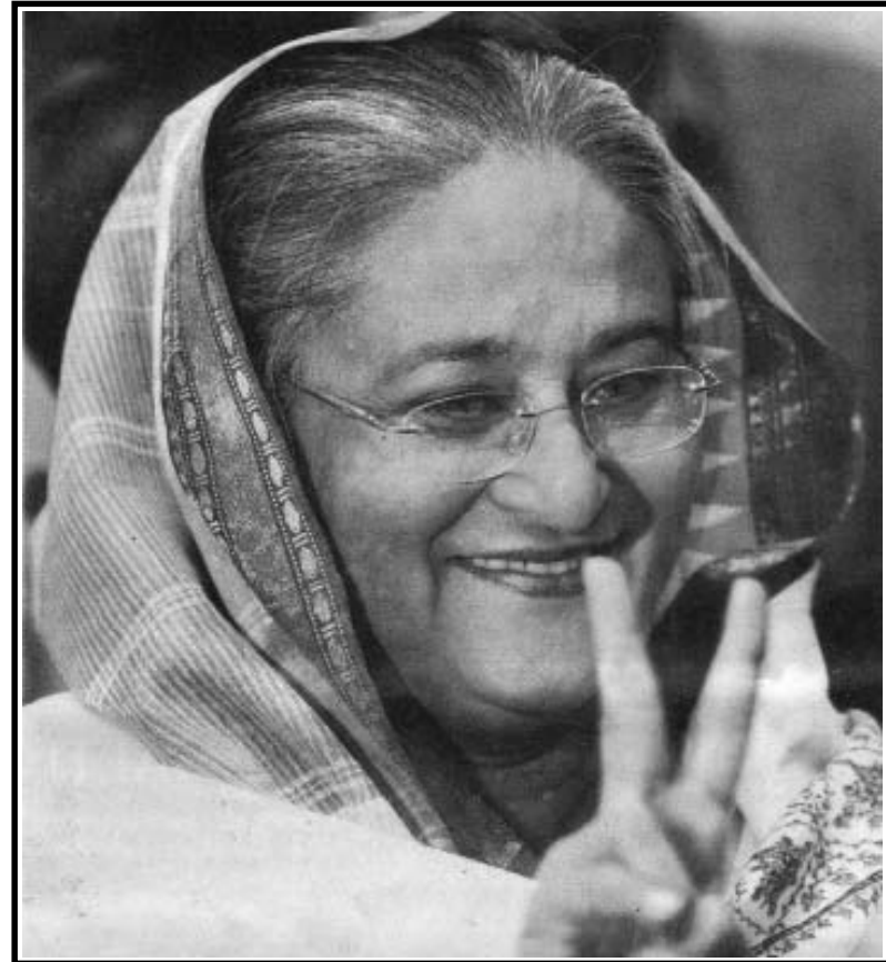
ബംഗളൂരുവിൽ നടന്ന പൊതുതിരഞ്ഞെടുപ്പിൽ യാഥാസ്ഥിതികർക്കെതിരായ ജനരോഷത്തിന്റെ തരംഗത്തിനുമീതെ സഞ്ചരിച്ചുകൊണ്ട് ഷേഖ് ഹസീന വീണ്ടും നേതൃത്വത്തിലെത്തി.