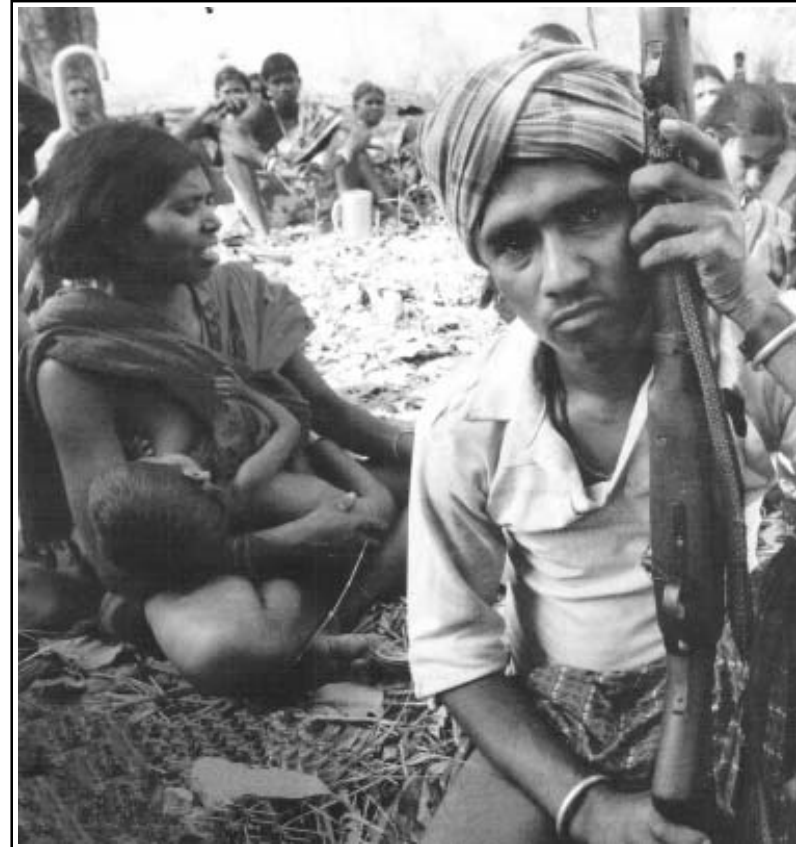
വേട്ടയാടപ്പെടുന്ന ആദിവാസികളും നാട്ടിൽ കിടക്കപ്പെടുത്തിയ മുട്ടിയ ദളിതുകളും മറ്റുമാണ് അവസാനം നക്ഷൽ ആയി രൂപാന്തരപ്പെടുന്നത്. തോക്ക് അതിനു മറുമരുന്ന്ല്ല.