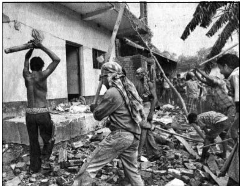
പോലീസ് അതിക്രമവിരുദ്ധ കമ്മിറ്റിക്കാർ മാർക്സിസ്റ്റ് മേഖല കമ്മിറ്റി മെമ്പറായ ചാനീകരന്റെ വീട് തല്ലിക്കൊടുത്തു.

മാർക്സിസ്റ്റ് സ്ഥാനാർത്ഥികൾ തോറ്റുവെന്നല്ല, മാർക്സിസ്റ്റുകാരുടെ വീടുകളിൽനിന്ന് ആയുധശേഖരങ്ങൾ പിടിച്ചെടുക്കുകയും ചെയ്തത് ഖൈജൂരിയിൽ സംഘർഷാത്മകമായ ഒരന്തരീക്ഷം സൃഷ്ടിച്ചിരുന്നു. ഖൈജൂരിയിൽ പലേടത്തും മാർക്സിസ്റ്റ് ഓഫീസുകൾ ജനങ്ങൾ തല്ലിക്കൊടുത്തു. പലതും തീവച്ചു നശിപ്പിച്ചു. നൂറുകണക്കിന് മാർക്സിസ്റ്റുകാർ ജീവനും കൊണ്ട് ഓടിരക്ഷപ്പെട്ടു. ഇങ്ങനെ