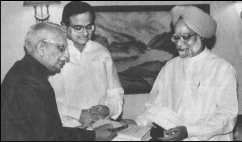
ജ: ലിബറാൻ പ്രധാനമന്ത്രി മൻമോഹൻ സിങ്ങിന് അയോധ്യാ അന്വേഷണ റിപ്പോർട്ട് സമർപ്പിക്കുന്നു.

ചുമരേഴുത്ത് വ്യക്തം. വിവരാവകാശ നിയമം ഗവർണ്മെണ്ട് ഭേദഗതി ചെയ്യാൻ പോകുന്നു. ഏതൊരു ഭേദഗതിയും ഗവർണ്മെണ്ടിന്റെ രഹസ്യങ്ങൾ സൂക്ഷിക്കാനുള്ളതാകും. അഴിമതിക്കാർ ഏറ്റവും ഭയപ്പെടുന്ന നിയമമാണിത്. ജനങ്ങൾ ഒത്തൊരുമിച്ച് ചെറുക്കാത്ത പക്ഷം വിവരാവകാശനിയമം ഒരു അലങ്കാര വസ്തുവായിത്തീരും. □