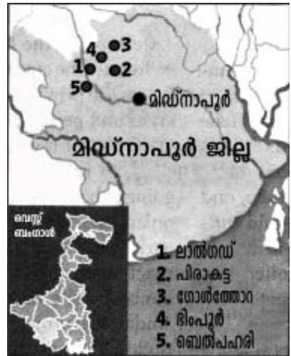
ബംഗാളിലെ മിഡ്നാപൂർ ജില്ലയിൽ മാവോയിസ്റ്റ് ശല്യമുള്ള മേഖലകൾ

ലാൽഗഡിൽ എന്താണ് സംഭവിച്ചതെന്ന് കുറിച്ചിടേണ്ടത് ഒരാവശ്യമാണ്. കഴിഞ്ഞ ചില ദശകങ്ങളിലായി മാർക്സിസ്റ്റുകാർ സമഗ്രാധിപത്യത്തിന്റേതായ ഒരു സംവിധാനം പടുത്തുയർത്തിയിരുന്നു. ജനങ്ങളുടെ പരാതികൾ പരിഹരിക്കാൻ ഇതി