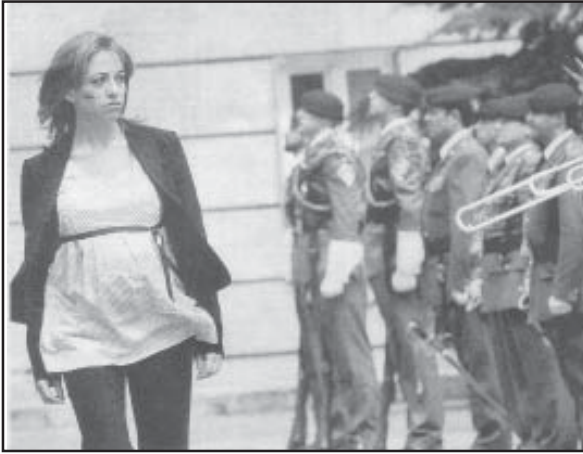
പരേഡ് പരിശോധിക്കുന്ന ദേശരക്ഷാമന്ത്രി കാർമെ ചാക്കോൻ