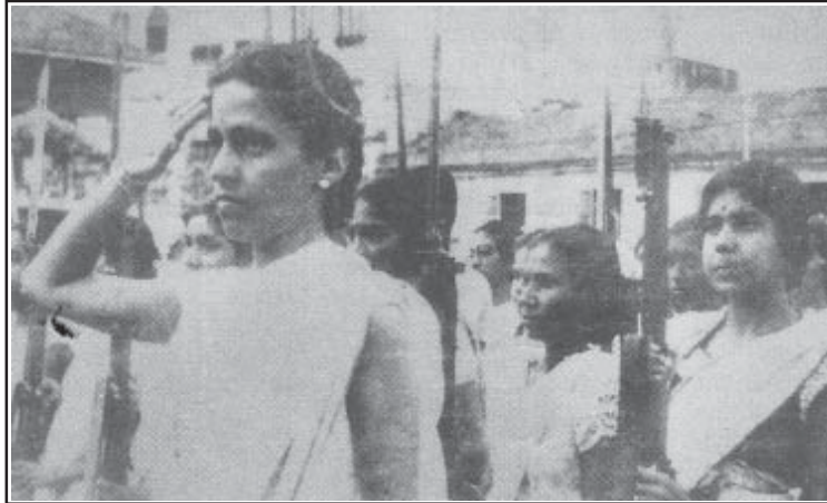
1934ൽ ഐ.എൻ.എ. പരേഡിൽ ലക്ഷ്മി

ദൽഹിയിലെ ഒറിസാനിവാസിലെ ഒരു എയർ കണ്ടീഷൻ മുറിയിൽ വച്ചാണ് ഞാൻ ലക്ഷ്മി ഇന്ദിരാപണ്ഡയെ ആദ്യമായി കണ്ടത്; സ്വാതന്ത്ര്യദിനത്തിന്റെ അടുത്ത ദിവസം. ലക്ഷ്മി ഒരു ഐ. എൻ.എ.