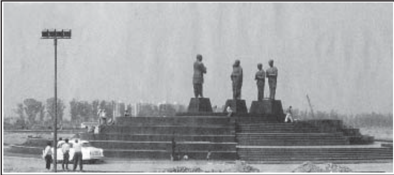
അംബേദ്കറുടെ ദീക്ഷാസീകരണത്തിന്റെ ശില്പരൂപം

ഭോവിയിലേക്കാവശ്യമായ സാങ്കേതിക വിദഗ്ധരെ വാർത്തെടുക്കാനുള്ള ഇൻസ്റ്റിറ്റ്യൂട്ടുകളാണ് നെഹ്റു സ്വപ്നം കണ്ടിരുന്നത്. അവതാണ്ടുകൾക്കു ശേഷം യു.പി. മുഖ്യമന്ത്രി മായാവതി സ്വപ്നം കാണുന്നതും അത്തരമൊരു സ്ഥാപനമാണ്. ഒരു വ്യത്യാസമേയുള്ളൂ- ദുർബല ജന വിഭാഗങ്ങളുടെ കാര്യത്തിൽ മായാവതി പ്രത്യേകം ഊന്നൽ നൽകുന്നു.