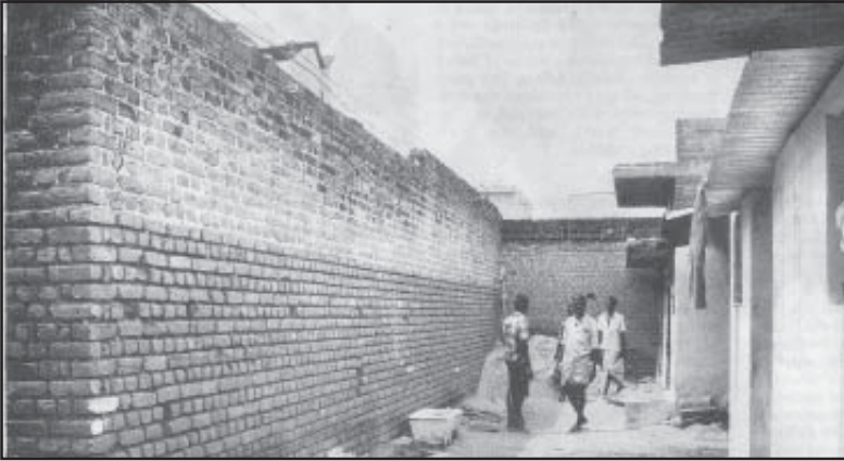
ഉത്തപുരം ഗ്രാമത്തിലെ അയിത്തമതിൽ

മിഴുനാട്ടിലെ മധുരാ ജില്ലയിൽപ്പെട്ട ഉത്തപുരം ഗ്രാമത്തിൽ അയിത്തക്കാരുടെ ശല്യം ഒഴിവാക്കാനായി സവർണർ ഒരു പടുകുറ്റൻ മതിൽ പണിതുയർത്തി. അതിനും പുറമെ മതിലിന്നു മീതെ കമ്പി വലിച്ചു വൈദ്യുതി പ്രവഹിപ്പിക്കുകയും ചെയ്തു.