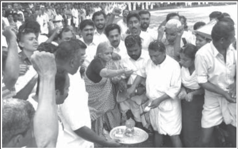
എറയാംകുടിയിലെ വിതസമരം കവയത്രി സുകതകുമാരി ഉദ്ഘാടനം ചെയ്യുന്നു.

അഴുകിയ ഗന്ധവുമില്ലാത്ത വായു ശ്വസിക്കാനുള്ള അവകാശത്തിനുവേണ്ടി, എറയാംകുടിയിലെ ആവാസവ്യവസ്ഥയുടെ നിലനിൽപ്പിനുവേണ്ടി, അതിജീവനത്തിനുവേണ്ടി സമരത്തിനിറങ്ങുകയായിരുന്നു. ഈ സമര പ്രവേശത്തിൽ ജീവന്റേതായ ഒരു ബോധതലമുണ്ട് എറയാംകുടിയിൽ.