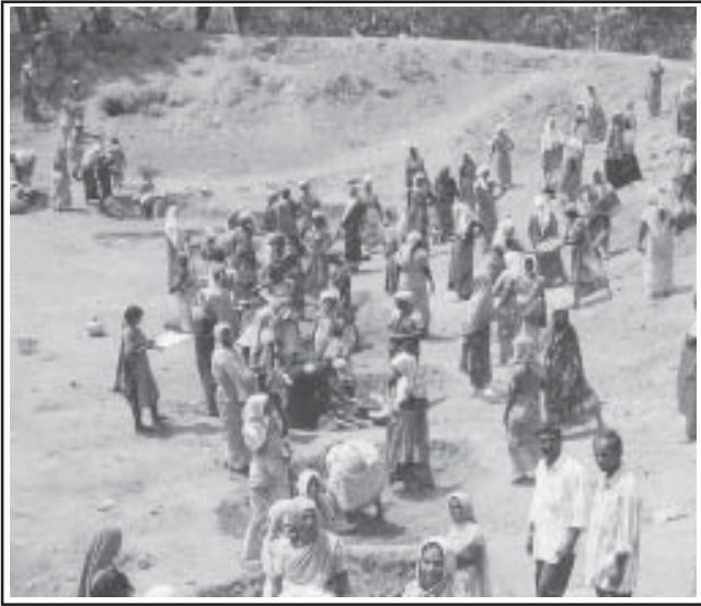
തമിഴ്നാട്ടിലെ വില്ലുപുരം ജില്ലയിൽ തൊഴിലുറപ്പുപദ്ധതി പ്രകാരം കൂളത്തിന് ആഴംകുട്ടുന്ന സ്ത്രീകൾ

എന്നാൽ പദ്ധതി നടപ്പാക്കുന്ന കാര്യത്തിൽ വിവിധ സംസ്ഥാനങ്ങൾക്കിടയിലുള്ള അന്തരം നടുക്കിക്കളയുന്നതാണ്. ചില സംസ്ഥാനങ്ങൾ തൊഴിലുറപ്പുപദ്ധതിയെ സ്വന്തം പദ്ധതിയായി ആവേ