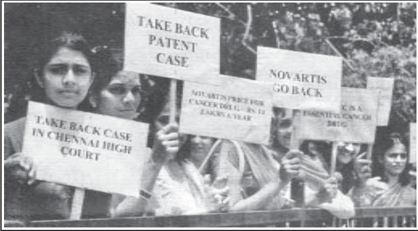
നൊവാർട്ടിസ്സിന്റെ മുംബായിലെ ഓഫീസിനുമുമ്പിൽ ക്യാൻസർ രോഗികൾ നടത്തുന്ന പ്രതിഷേധ പ്രകടനം

ഇന്ത്യയിലെ പേറ്റന്റ് നിയമത്തെ ചോദ്യം ചെയ്തുകൊണ്ട് സിവിൽ കമ്പനിയായ നൊവാർട്ടീസ് സമർപ്പിച്ച ഹർജി മദ്രാസ് ഹൈക്കോടതി ആഗസ്ത് ന്ന് തള്ളി. കുറഞ്ഞ വിലക്ക് ഔഷധങ്ങൾ നിർമ്മിച്ച് വിതരണം ചെയ്യാൻ ഇന്ത്യയിലെ ഔഷധ നിർമ്മാണ ശാലകൾക്ക് ഈ വിധി വഴിതുറന്നു കൊടുത്തു.