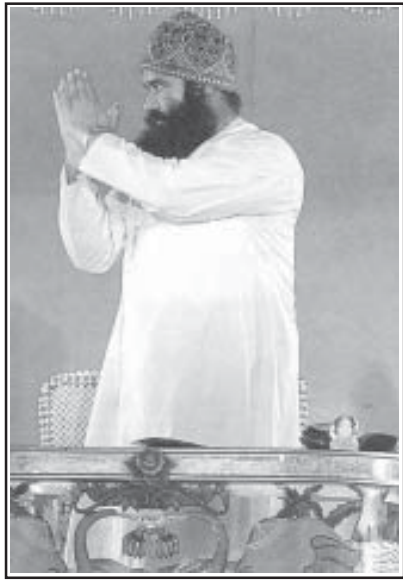
സച്ചസൗദ എന്ന ദേരയുടെ തലവനായ ഗുരുമീത് റാം റഹിം സിങ്

വുമധികം ദളിതുകളുള്ള സംസ്ഥാനം പഞ്ചാബാണ്. പഞ്ചാബിലെ ജനസംഖ്യയിൽ 29 ശതമാനവും ദളിതുകളാണ്. ഇവർ പലജാതികളിലും മതങ്ങളിലും പെടുന്നു. ഇവർ ഏറെക്കുറെ ഭൂരഹിതരാണെന്നു പറയാം. ജനങ്ങളിൽ 29 ശതമാനവും ദളിതുകളാണെങ്കിലും കൃഷിഭൂമിയിൽ രണ്ടര ശതമാനമേ ദളിതുകളുടെ അധീനത്തിലുള്ളൂ. ഈ ദളിതുകളിൽ ഏറ്റവും ദരിദ്രരായവർ സിക്ക്കുകാരായ ദളിതുകളാണ്. സാമൂഹ്യമായ മേൽഗതിക്കു വേണ്ടിയാണിവർ സിക്ക്മതം സ്വീകരിച്ചതെങ്കിലും, അവിടേയും അവർ അയിത്തക്കാരാണ്. തന്മൂലം ദളിത് സിക്ക്കുകാർക്ക് സ്വന്തമായി ഗുരുദാരങ്ങളും കല്യാണ മണ്ഡപങ്ങളും ശ്മശാനങ്ങളുമെല്ലാം ഉണ്ടാ