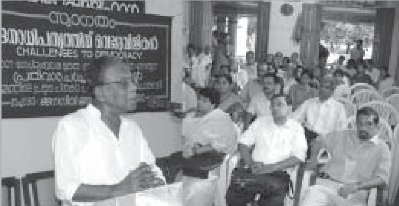
ജനാധിപത്യത്തിന് വെല്ലുവിളികൾ - എന്ന ജനനീതിയുടെ പ്രഭാഷണ പരമ്പര സാഹിത്യ അക്കാദമിയിൽ ഡോ. സുകുമാർ അഴീക്കോട് ഉദ്ഘാടനം ചെയ്ത്, ആദ്യ പ്രഭാഷണം നടത്തുന്നു.

വെള്ളിയാഴ്ചകളിൽ തുടർച്ചയായി ജനനീതി സംഘടിപ്പിച്ചുവരുന്ന ജനാധിപത്യ ചർച്ചാസദസ്സുകളിൽ കേരളത്തിലെ പ്രശസ്തരായ ചിന്തകർ, ഗ്രന്ഥകാരന്മാർ, സാഹിത്യ-സാംസ്കാരിക പ്രവർത്തകർ എന്നിങ്ങനെ വിവിധ മേഖലകളിൽ ലബ്ധപ്രതിഷ്ഠരായ വർ പങ്കെടുത്തു സംസാരിക്കുന്നു.