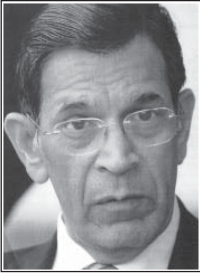
ജസ്റ്റിസ് വൈ.കെ. സഭർവാൾ

ഏതാണ്ടിതേ കാലത്ത് സുപ്രീം കോടതിയുടെ മറ്റൊരു ബഞ്ച്, നാഗ്പൂർ മഹി ചേരിയും മറ്റു ചേരികളും പൊളിച്ചുകളയാൻ കല്പന നൽകി. ഇതു ലക്ഷക്കണക്കിനാളുകളെ ഭവനരഹിതരാക്കി. അറുവേനലിലെ കൊടും വെയിലിൽ അവർ തങ്ങളുടെ തകർക്കപ്പെട്ട വീടുകൾക്കരികെ അലഞ്ഞു.