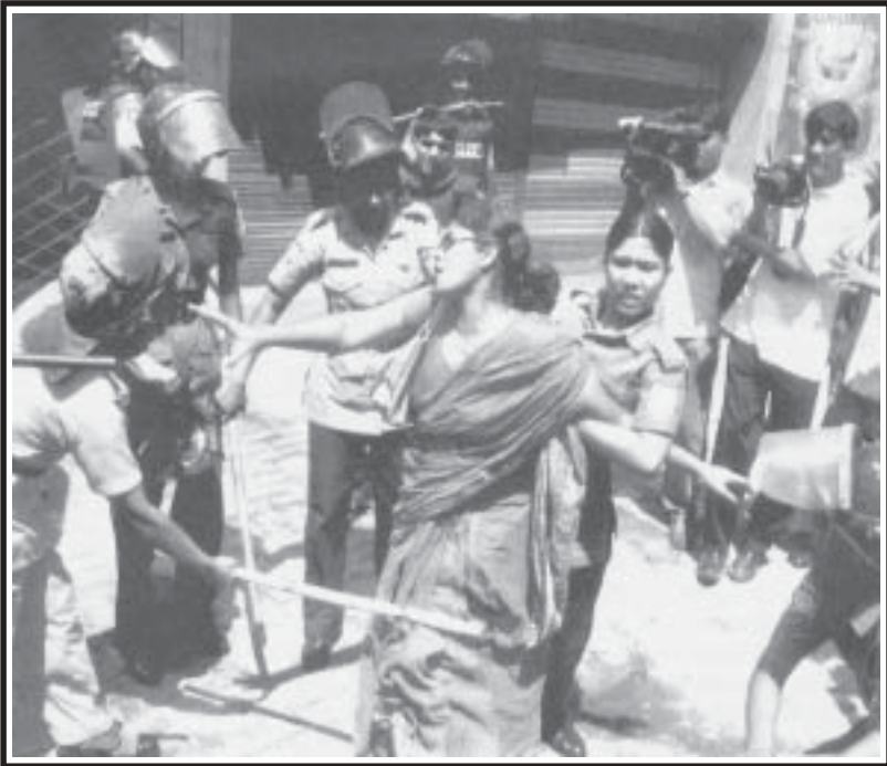
ബംഗളാ പോലീസ് പ്രതിപക്ഷക്കാർക്കെതിരെ നടത്തുന്ന അതിക്രമങ്ങൾക്കിടയിൽ നിർദ്ദോഷിയായ ഒരു വീട്ടമ്മയെ ആക്രമിച്ചപ്പോൾ (പേജ് 8)